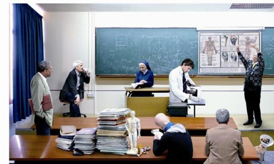
“Pain Killers (Comité de Expertos contra el dolor)”. Miguel Ángel Tornero. 1er premio de II Premio de Arte GRÜNENTHAL.

Guadalajara, Jueves 9 de Febrero de 2012